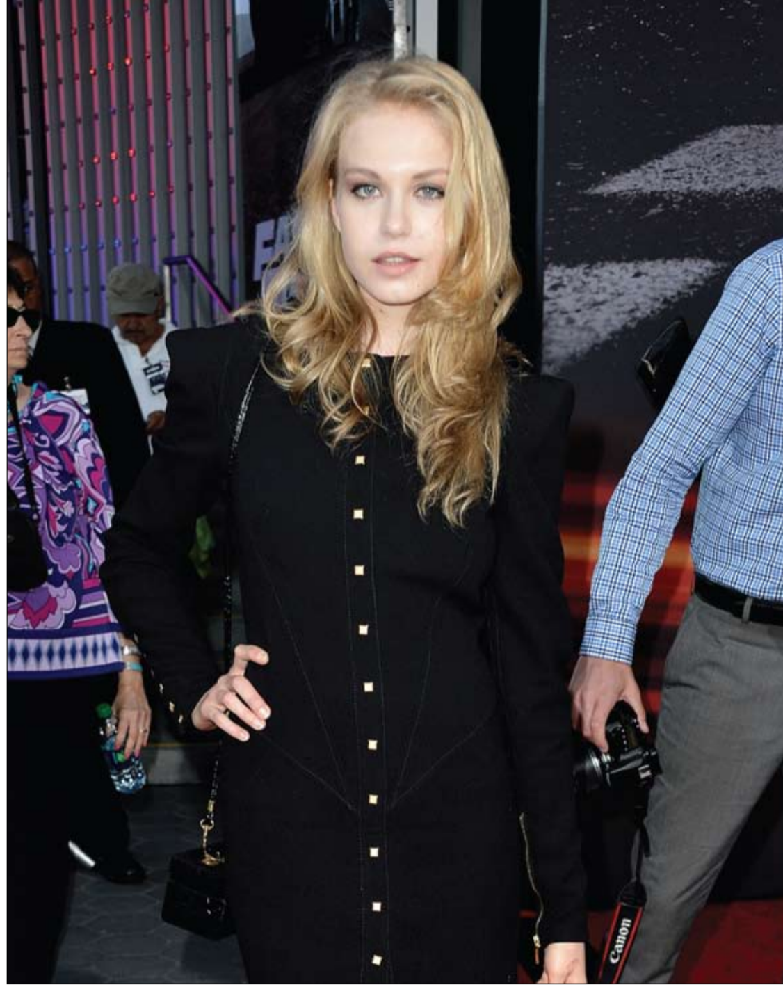
المثلة بينيلوب ميتشل لحظة وصولها لحضور العرض الأول لفيلم (سريع وغاضب 1) في يونيفرسال سيتي بكاليفورنيا.

وقالت الباحثة مارغريتا غوميز اسكالادا ان هذه النتائج المبدئية تفتح المجال للعديد من الأبحاث لدراسة فاعلية خلاصة الزعرتر كعلاج لطيف على البشرة لحب الشباب وبالتالي وضع حد لعاناة حب الشباب الأثرية.